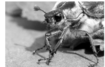
19 Maikäfer