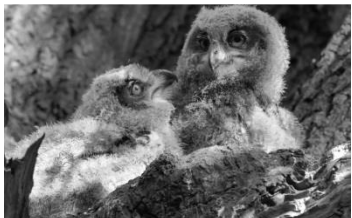
01 Uhus

Homepage der Fotogruppe: www.fotogruppe-nabu-hamburg.de