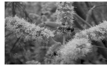
20 Bienenwolf