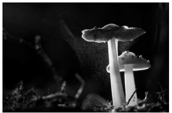
16 Sporenflug