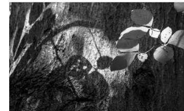
05 Schattenspiel