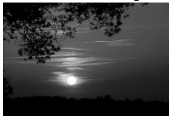
17 Abend (Fischbeker Heide)