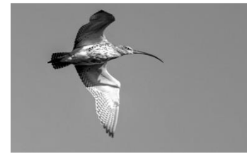
06 Großer Brachvogel