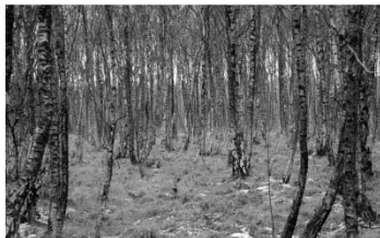
02 Birkenwald