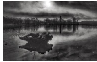
04 Stadtpark Harburg