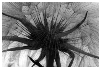
09 Paps des Wiesenbocksbart