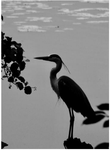
23 Graureiher