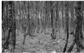
02 Birkenwald