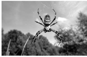
03 Wespenspinne