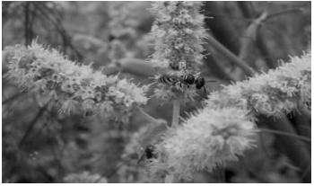
20 Bienenwolf