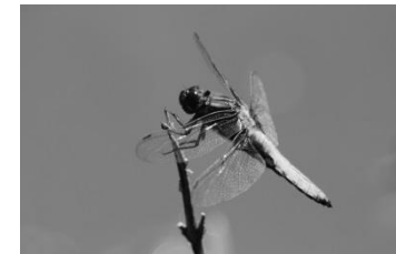
12 Plattbauch (Libelle)