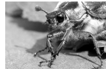
19 Maikäfer