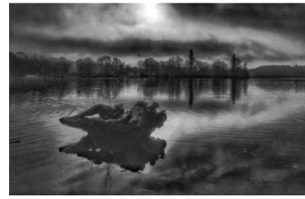
04 Stadtpark Harburg