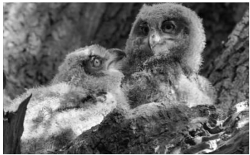
01 Uhus

Großformatige schwarz-weiße Landschaftsfotos der Natur in Hamburgs Süden wechseln sich in dieser Bilderschau mit Fotos aus Flora und Fauna ab. Es sind Motive aus besonderen fotografischen Perspektiven zu sehen, die man bei einem Spaziergang durch diese Gegenden vielleicht bisher noch nicht wahrgenommen hat. Die Fotogruppe NABU Hamburg besteht seit November 2014 und hat zurzeit 23 Mitglieder. Sie trifft sich regelmäßig am 4. Montag eines Monats in Neuwiedenthal, im Striepensaal, Striepenweg 40 um 19.30 Uhr und beschäftigt sich mit Bildbesprechungen, Planungen von Fotoexkursionen und behandelt viele aktuelle fotografische Themen.