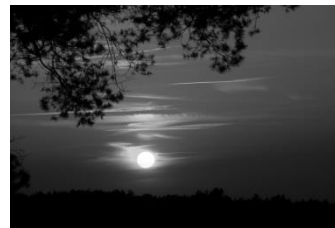
17 Abend (Fischbeker Heide)