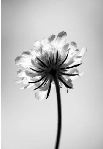
24 Sommerblume