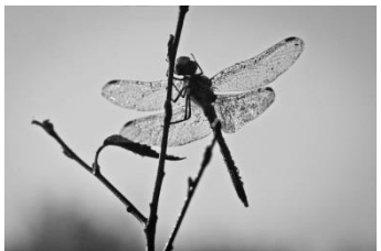
14 Libelle