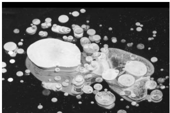
07 Eisblasen (Neugrabener Moor)