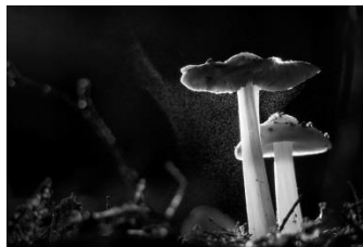
16 Sporenflug