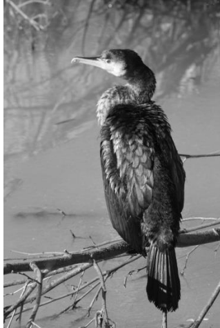
25 Kormoran