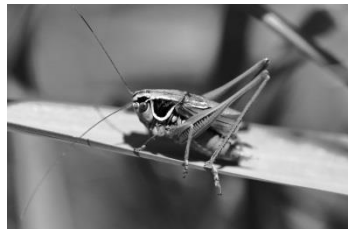
08 Roesels Beißschrecke