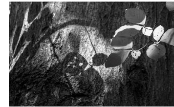
05 Schattenspiel