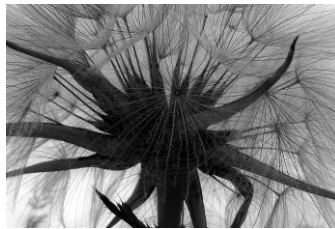
09 Papus des Wiesenbocksbart