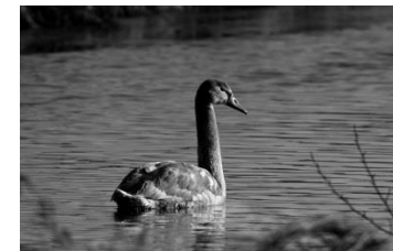
18 Junger Schwan