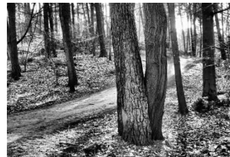
11 Im Wald