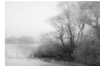
13 Morgennebel (Moorwerder)