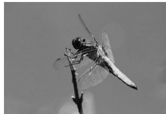
15 Plattbauch