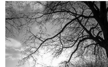
5 Bunthäuser Spitze