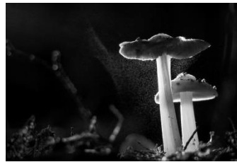
9 Sporenflug