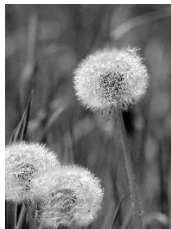
8 Löwenzahn