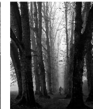
6 Elbpark