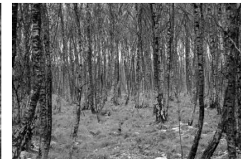
17 Birkenwald