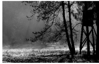
3 Der Tag beginnt