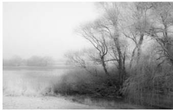
2 Morgennebel (Moorwerder)