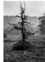
4 Morgennebel/Fischb. Heide