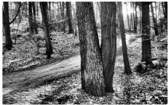
1 Im Wald

Homepage der Fotogruppe: www.fotogruppe-nabu-hamburg.de