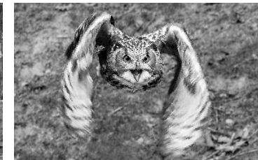
18 Uhu