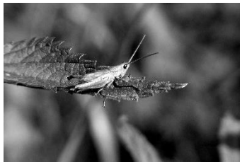
14 Goldschrecke