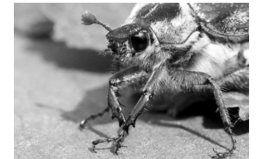
12 Maikäfer