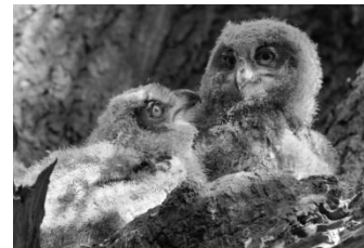
16 Uhus