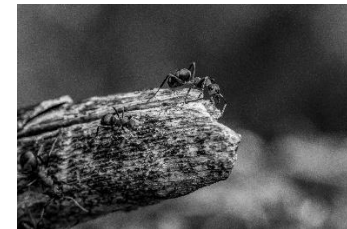
11 Ameise