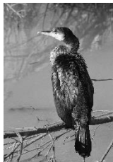
7 Kormoran