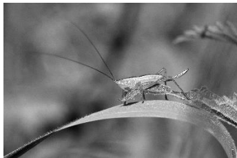
13 Heuschrecke